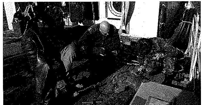
De wrakdelen worden geïdentificeerd aan boord van het duikvaartuig Hydra.