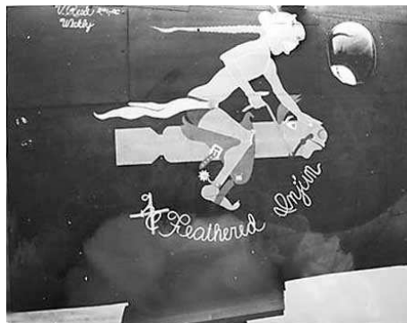
Twee versies van de nose-art van de No Feathered Injun