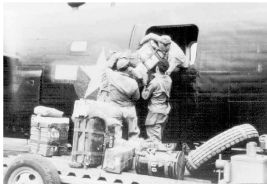
Het beladen van een Liberator

De slag om Arnhem begint als onderdeel van Operation Marketgarden met een inleidend bombardement op de stad. 's Middags landen bijna 5200 man van de Eerste Britse Luchtlandingsbrigade, deels per parachutes en deels in zweefvliegtuigen. In sommige zweefvliegtuigen werden jeeps en anti-tankgeschut aangevoerd. Tijdens de overtocht vanuit Engeland ging door ongelukken een deel van de uitrusting verloren. Deze uitrusting moest opnieuw aangevoerd worden.