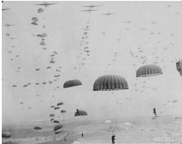
Geallieerde parachutisten bij Arnhem

De voorlaatste missie van de crew van Gerow: Mission 166 Target Hannover . Opdracht: om een depot op te blazen waar men wapens produceert. Ondanks het verlies van toestellen en manschappen blijkt het een geslaagde missie.