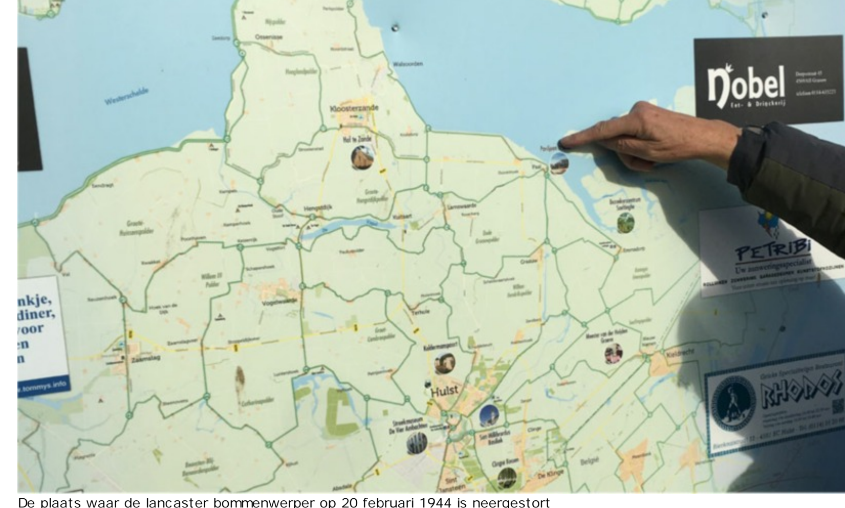
De plaats waar de Lancaster bommenwerper op 20 februari 1944 is neergestort