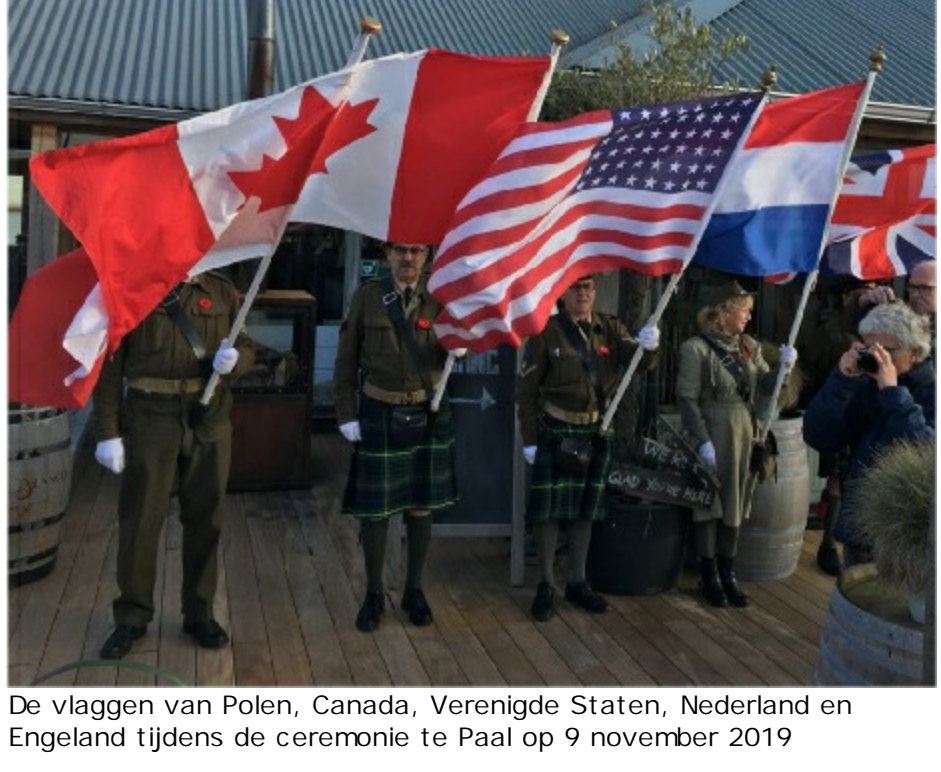
De vlaggen van Polen, Canada, Verenigde Staten, Nederland en Engeland tijdens de ceremonie te Paal op 9 november 2019

In het begin van 1944 waren de plannen voor de Geallieerde landingen in Normandië in de afrondende fase gekomen. In de planning was onder meer opgenomen een campagne om boven West Europa overwicht in de lucht te krijgen. Als eerste van een reeks omschreven doelen (vliegtuigfabrieken, vliegvelden, brandstofproductie, radarstations etc.) werd de vliegtuigindustrie gekozen. De eerste aanval zou beginnen midden februari 1944 met als doel: de Messerschmitt fabrieken in Leipzig. Pas op 19 februari was het weer goed genoeg om de bommenwerpers op weg te sturen. 's Avonds vertrokken 823 Lancasters en Halifaxen richting Leipzig. Rond drie uur 's nachts werd 2300 ton bommen afgeworpen. De middag erop voerde de USAAF met 200 bommenwerpers een