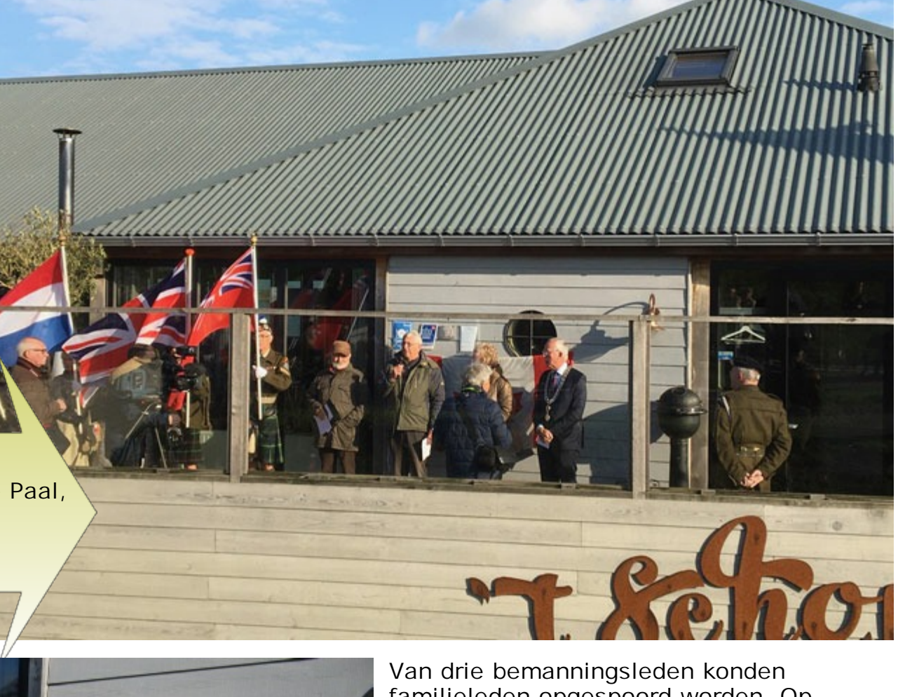
Paviljoen 't Schor te Paal, waar het monument geplaatst is

Het project van de Gemeente Hulst "Versterk de Scheldedorpen" bood de kans om een gedenkplaat te plaatsen op Paal. Er werd gekozen voor plaatsing aan de voorgevel van Paviljoen 't Schor. Vanuit het Restaurant is er nl. rechtstreeks zicht op de crashplaats.