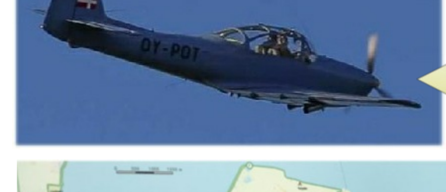
Eresaluut door de Focke-Wulf FWP 149D uit Seppe